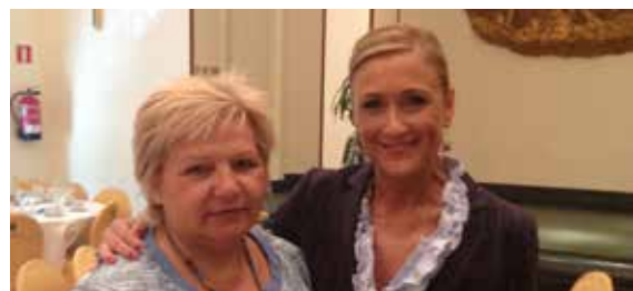
Cristina Cifuentes con Ángeles Pedraza.