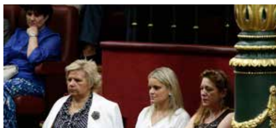
Día de las Víctimas del Terrorismo en el Congreso.