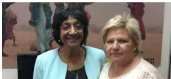
Con la Alta Comisionada de Naciones Unidas.