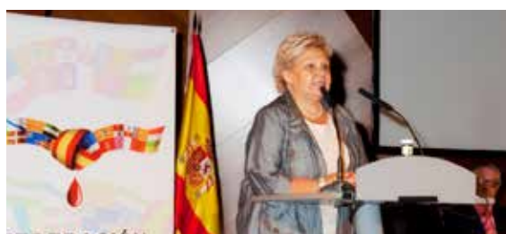
Acto del Día Mundial del Donante de Sangre.