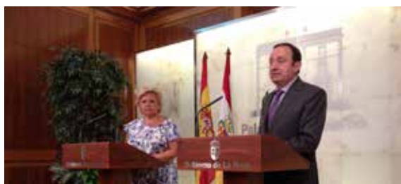
Comparecencia de prensa de Pedro Sanz.