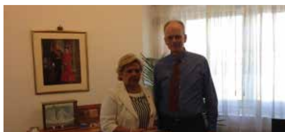
Reunión con el Embajador de Noruega.