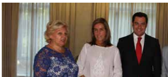
Reunión con Ana Mato, Ministra de Sanidad.