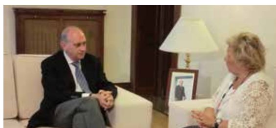
Reunión con el Ministro del Interior Jorge Fernández.