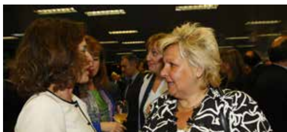
Encuentro con Ana Botella, Alcaldesa de Madrid.