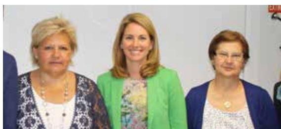
Visita de Arantza Quiroga a la sede de la AVT.